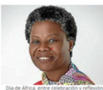
Día de África, entre celebración y reflexión

El Día de África suele generar sentimientos encontrados. Por un lado, estamos las personas que lo queremos celebrar como un día de fiesta; salir a la calle vestidas con bubús, chilabas y turbantes, bailar a ritmo de djembé el tiempo acompaña, en el caso de las diásporas africanas en Europa. Por otro lado, están quienes advierten que no hay nada que festejar, el día debe servir para reflexionar sobre los males que acechan al continente y a las personas africanas, y la responsabilidad, individual y colectiva, ante los mismos. Como todo en esta vida, se trata de encontrar equilibrios (hay personas que saben ser aguafiestas).